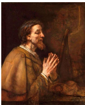
Saint-Jacques le Majeur (Rembrandt)

(MF) Le boulevard Saint-Jacques s'appelait auparavant le rang de la Misère. Ce n'est qu'en 1935 qu'on lui donna le nom de Rang Saint-Jacques, sur lequel l'ancienne école numéro 2 était bien en évidence.