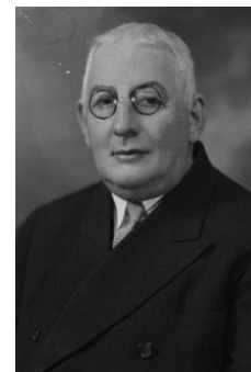
Pierre Bertrand

route nommé Sinclair. Par la suite le nom s'est francisé à Sainte-Claire .