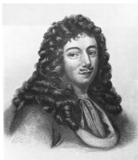
L'Intendant Jean Talon

(MF) Alors que la majorité de l'arrondissement Les Rivières est comprise dans la seigneurie St-Ignace et une partie de St-Gabriel, la paroisse Notre-Dame de Recouvrance (Vanier) était dans la Seigneurie de Saint-Joseph.